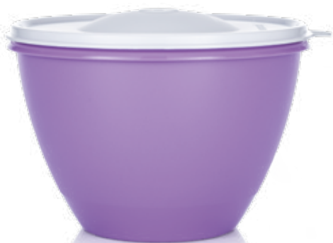
Magas Tál 1,9 L SS214009