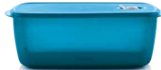
Mikróz&Tálal Magas Edény 3,5 L SS214014