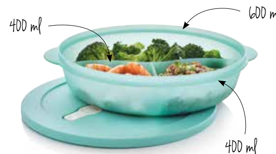
Új Generációs Osztott Kerek Edény 29,5 x 6,5 cm SS214015

Hagyd a tetőt rajta, és nyisd ki a szelepet, hogy csökkentsd a kifröccsenést a mikrohullámú sütőben.