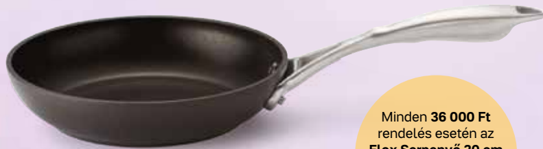
Mesterszakács Elox Serpenyő 20 cm PP214001