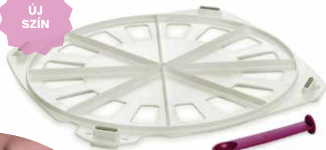
Ínyencvarázs 31 x 31 x 3 cm (adagolókanalat tartalmazza) SS214011